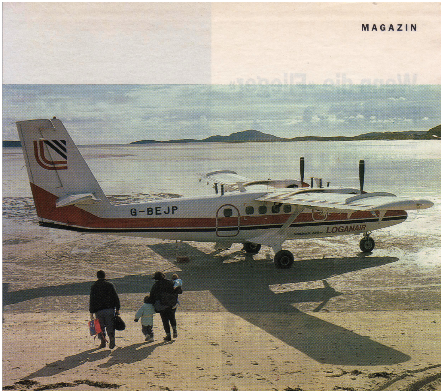
Auf dem Muschelsand der Hebrideninsel Barra kann die Twin Otter nur bei Ebbe landen.