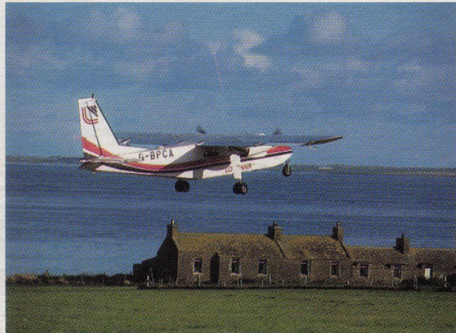
Start im Gras über die moosigen Crofts von North Ronaldsey.