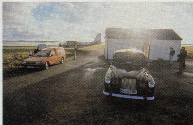
In Papa Westray hat man die Maschine ungeduldig erwartet.