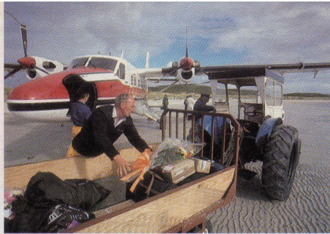
Auf dem sandigen Vorfeld von Barra fährt ein Traktor vor.

Kirkwall heisst der Hub für den nördlichsten Teil Schottlands, und so kann es schon einmal vorkommen, dass sich der Jetstream 31 aus Glasgow, die