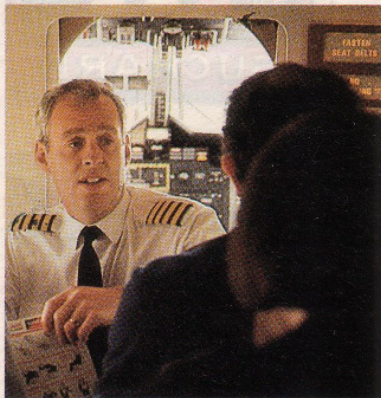
Vor dem Flug nach Barra instruiert der Inselhüpfer-Pilot die Passagiere im Gebrauch der Schwimmwesten.